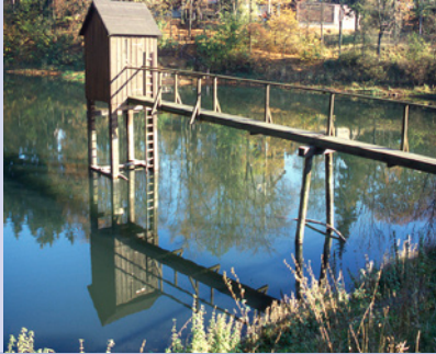
Das Striegelgerüst des Carler Teiches