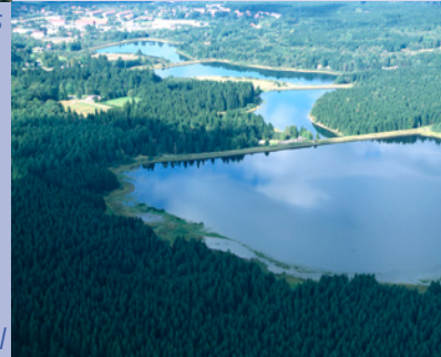
Die Pfauenteiche bei Clausthal